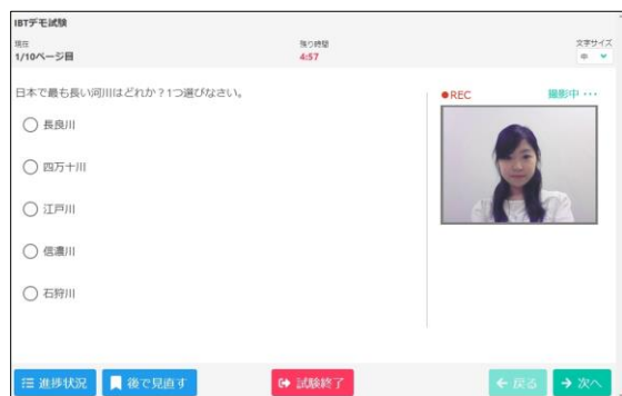
▲受験者は初期画像登録後に試験を開始、試験中はWebカメラにて監視を行います。