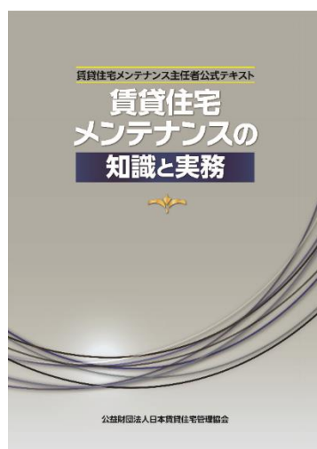
【公式テキスト表紙】